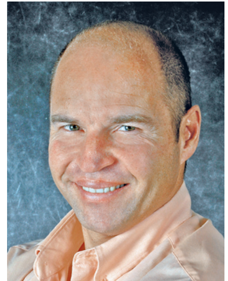
Marc Girardelli, Ex-Skirennläufer: „Auf konservative Anlagen zu setzen war im Nachhinein betrachtet eine kluge Entscheidung.“

Die Anlage erfolgte laut Girardelli „eher konservativ, ohne kostspielige Experimente“. Dazu rechnet er auch Aktien aus dem Schweizer Leitindex SMI, „im Nachhinein betrachtet eine kluge Anlagepolitik“, befin-